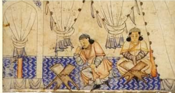
A Mongol prince studying the Koran.

Illustration of Rashid-ad-Din's Gami' at-tawarikh. Tabriz (?), 1st quarter of 14th century. Staatsbibliothek Berlin, Orientabteilung, Diez A fol. 70.